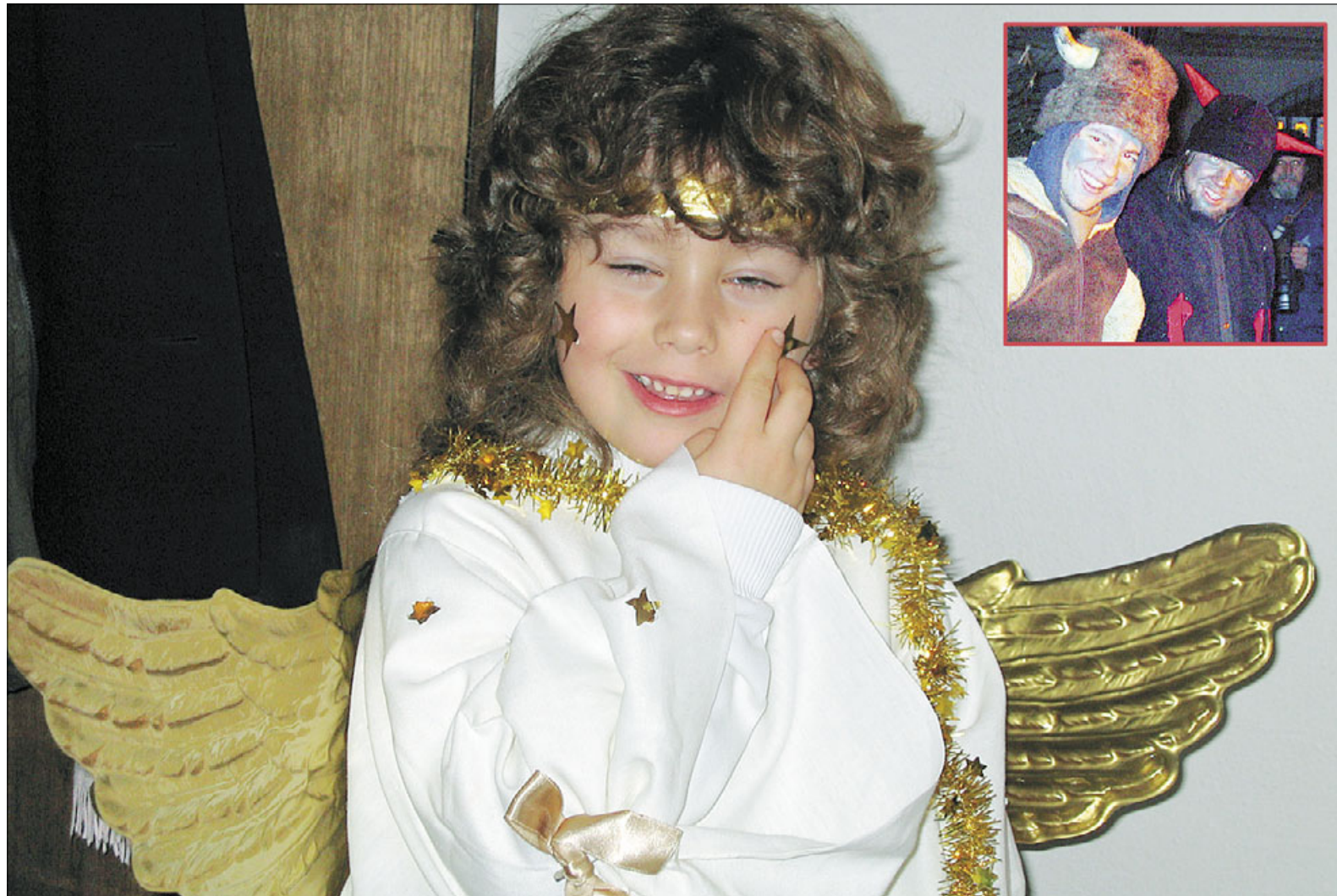
Čerty a anděly s Mikulášem vystřídá za týden Ježíšek. Šestitýdenní program akce Náš krumlovský advent, pořádané Městem Č. Krumlov, Městským divadlem Č. Krumlov, o. p. s., a Českokrumlovským rozvojovým fondem, spol. s r. o., pokračuje krásnými nabídkami k pobavení či zamyšlení. Byla by škoda nevyužít jich v čase přípravy na Vánoce ke svému prospěchu.