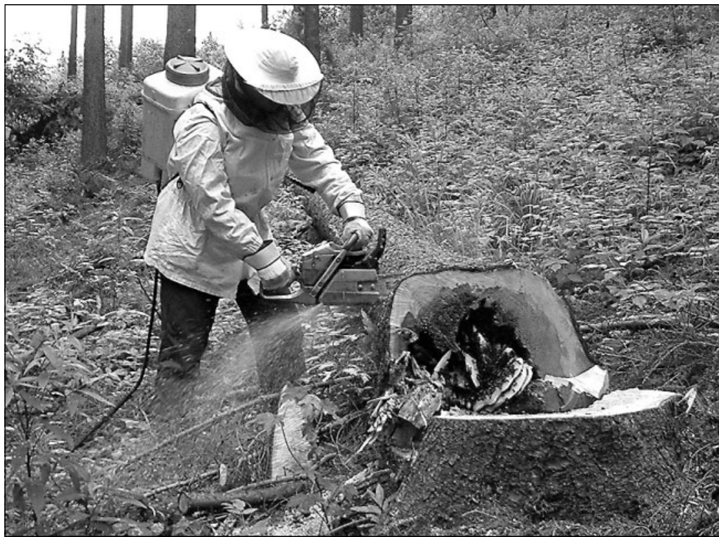
I stromy mávají zajímavé osudy. Tento napadla hniloba, následně se do takto vytvořené dutiny nastěhovaly divoké včely - a zkázu dovršil kúrovec.

A co bychom si přáli pro zdárné uskutečnění našich plánů? Jednak aby k nám byla příroda shovívavá a bořivý vítr a mokrý těžký sníh používala v jiných krajích. A aby naše lesy navštěvovali jen ukáznění občané a vandalové se nám vyhýbali.