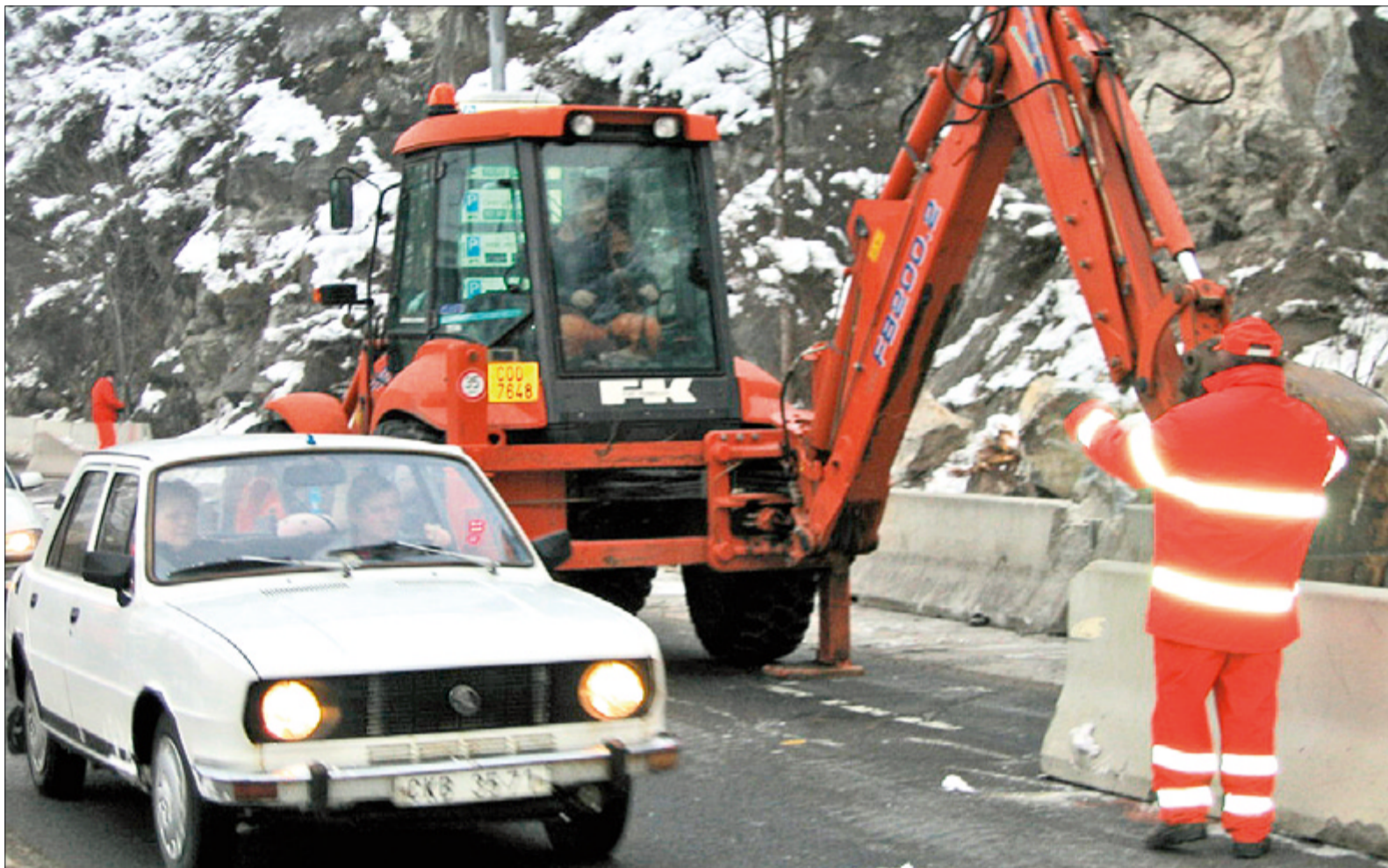
Po uvolnění kamenů ze skály na komunikaci I. třídy Pod Kamenem (státní), kdy 3. ledna na vozovku spadly i 19 a 10 tunový blok, vydal krajský úřad rozhodnutí o uzavření části vozovky ve směru na Lipno. Na snímku z minulého soboty je zabezpečování průjezdného pruhu betonovými citybloky pro zachycení dalších případně spadlých kamenů.