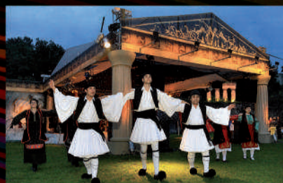
Národní večery jsou velmi oblíbené, letos byl v řeckém stylu a ani občasný deštík nepokazil skvělou atmosféru setkání plného tance, dobrého jídla a pití.