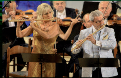
Skvělou tečku za festivalem udělal „mozartovský“ koncert Symfonického orchestru Českého rozhlasu pod vedením Vladimíra Válka. Sóla na flétnu zahrál Sir James Galway a Lady Jeanne Galway.

V příštím roce se festival uskuteční od 17. července do 22. srpna a jeho dramaturgie nezapomene na významné výročí, 700 let od založení Českého Krumlova. Už nyní jste srdečně zváni!