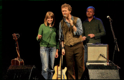
Na koncert Oskary ověčených , Markéty Irglové a Glena Hansarda přišlo natěšených tři tisíce diváků, kteří zpěváky nechtěli pustit z pódia ani po osmi předavcích.