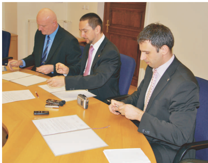
Hejtman Jihočeského kraje (zprava), primátor Českých Budějovic a starosta Českého Krumlova žádají zachování točny na svém místě.

Společné prohlášení k debatě o dalším osudu otáčivého hlediště v Českém Krumlově podepsali 6. ledna 2010 v Českých Budějovicích hejtman Jihočeského kraje Jiří Zimola, primátor Českých Budějovic Juraj Thoma a starosta Českého Krumlova Luboš Jedlička.