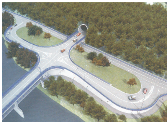
Vizualizace severního portálu tunelu.